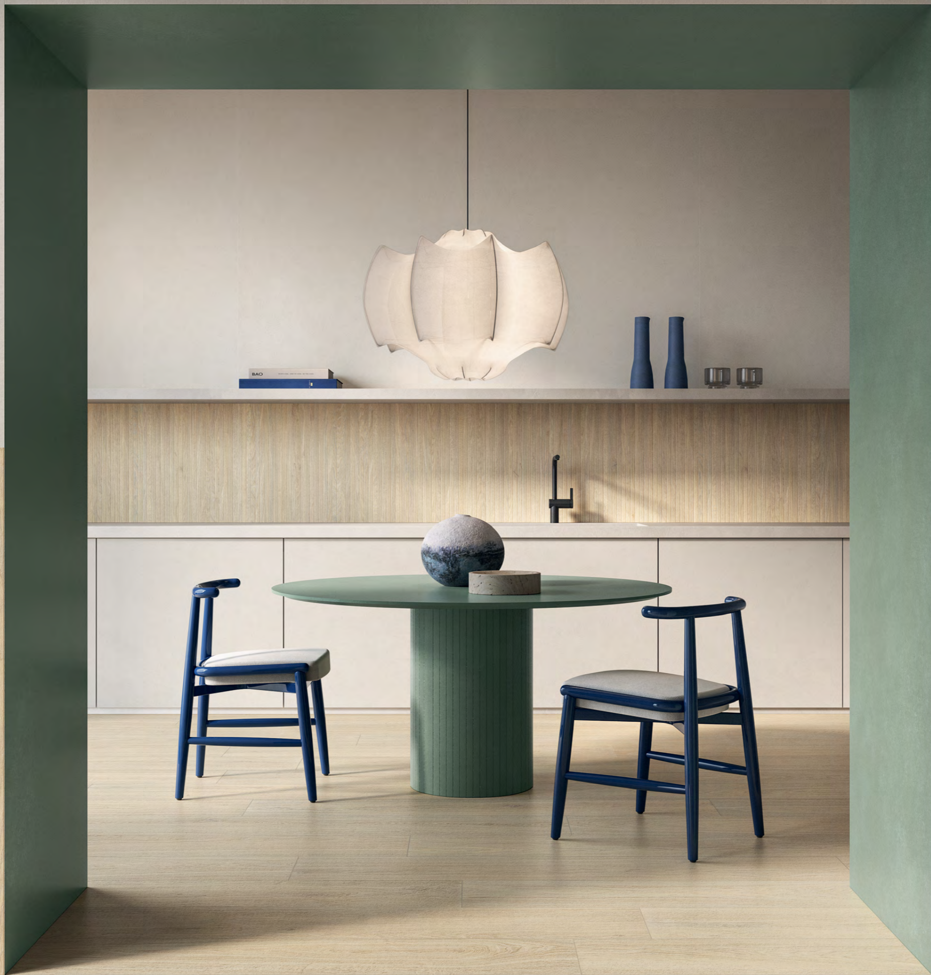
Essence Select Chiaro 26,5x160, Listello Tratto Chiaro 20x120, Nuances Bianco 120x280x0,6, Giada 120x280x0,6