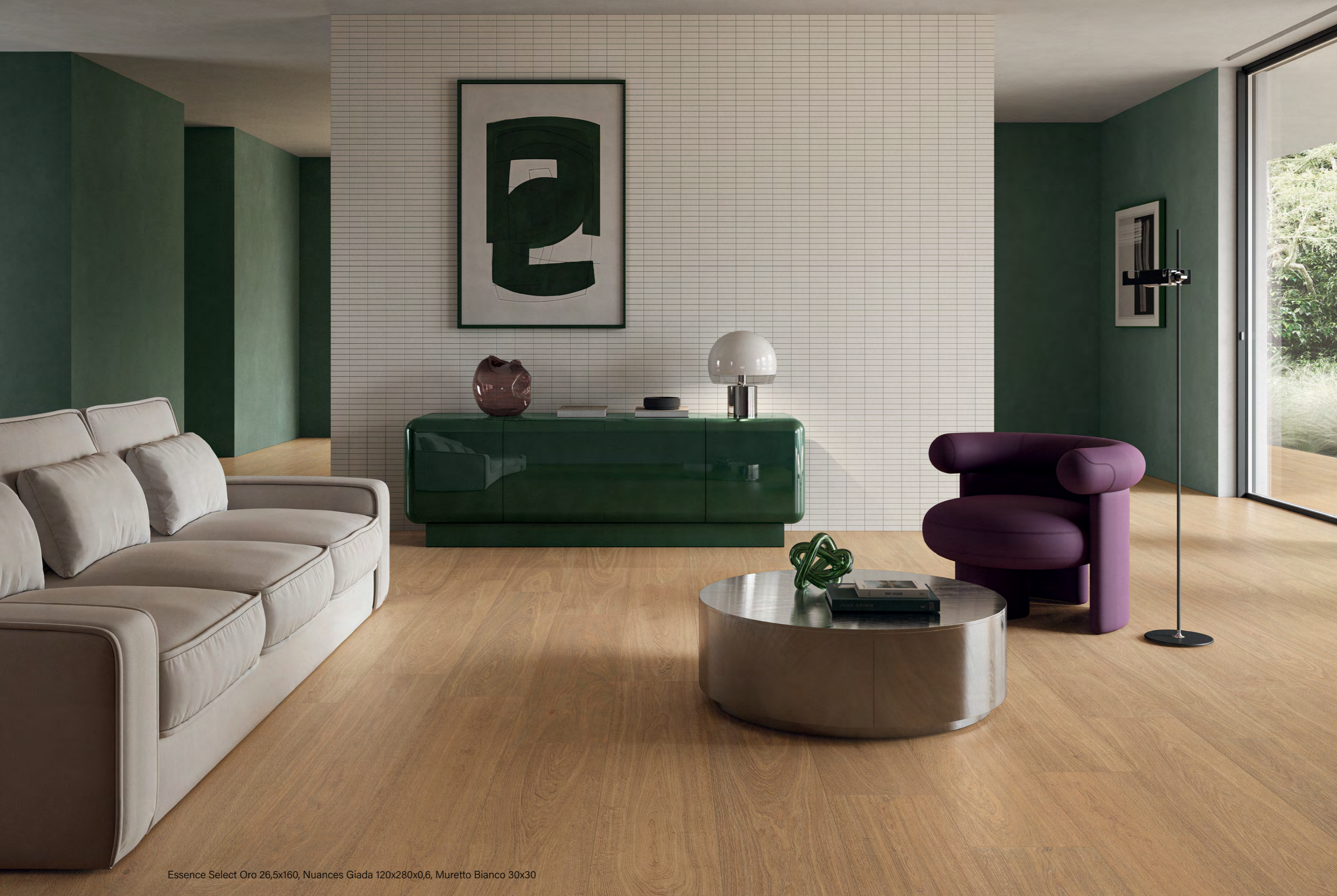
Essence Select Oro 26,5x160, Nuances Giada 120x280x0,6, Muretto Bianco 30x30