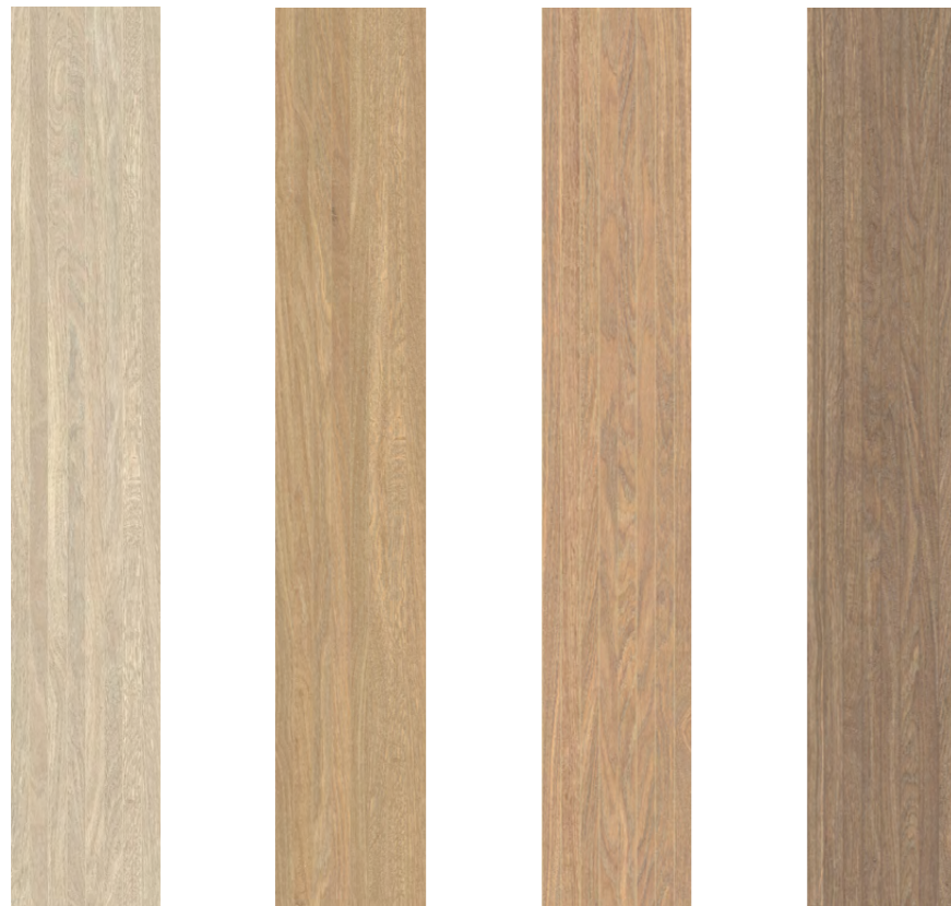
Chiaro SC01LT9 Miele SC02LT9 Oro SC03LT9 Mandorla SC04LT9