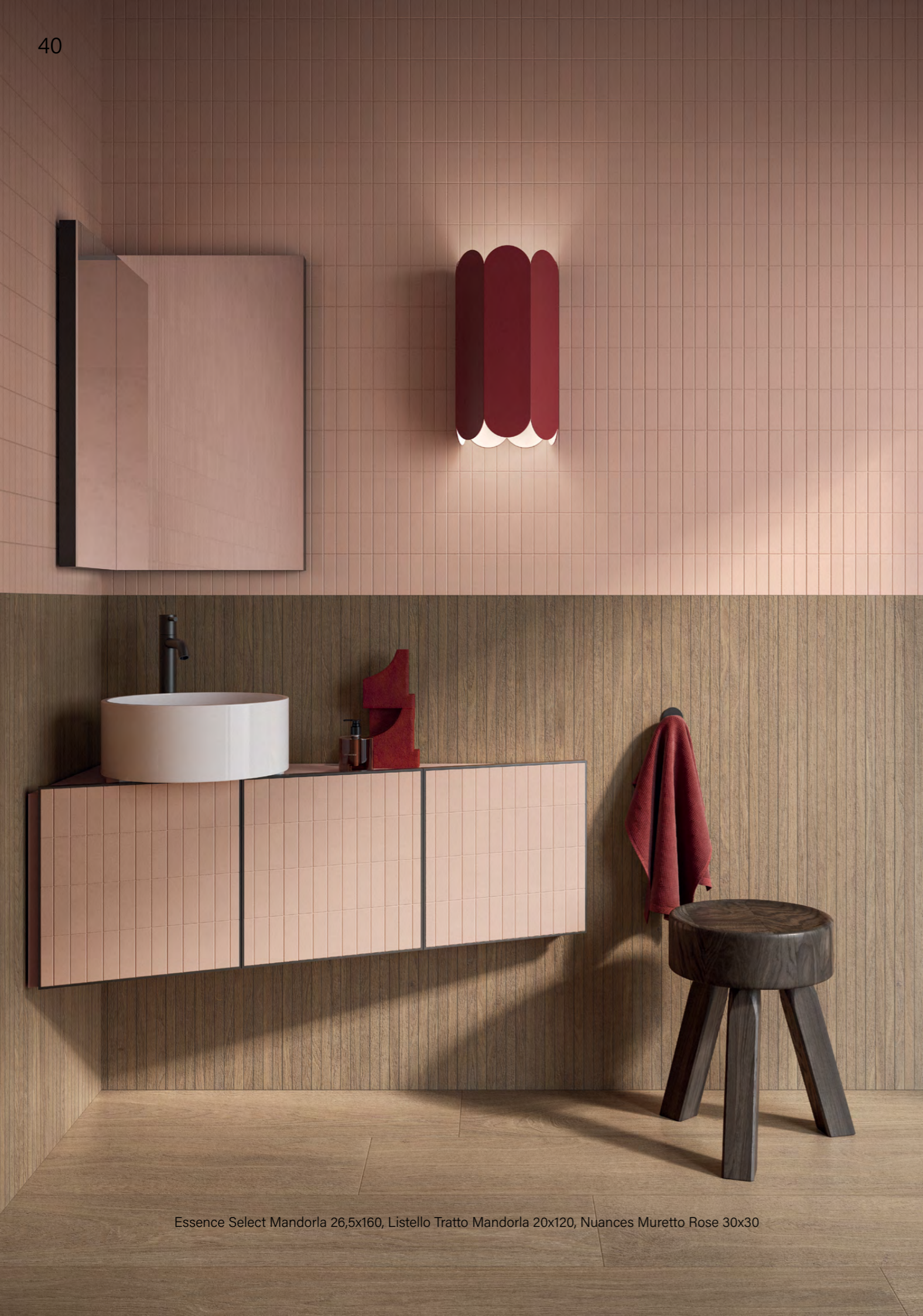
Essence Select Mandorla 26,5x160, Listello Tratto Mandorla 20x120, Nuances Muretto Rose 30x30