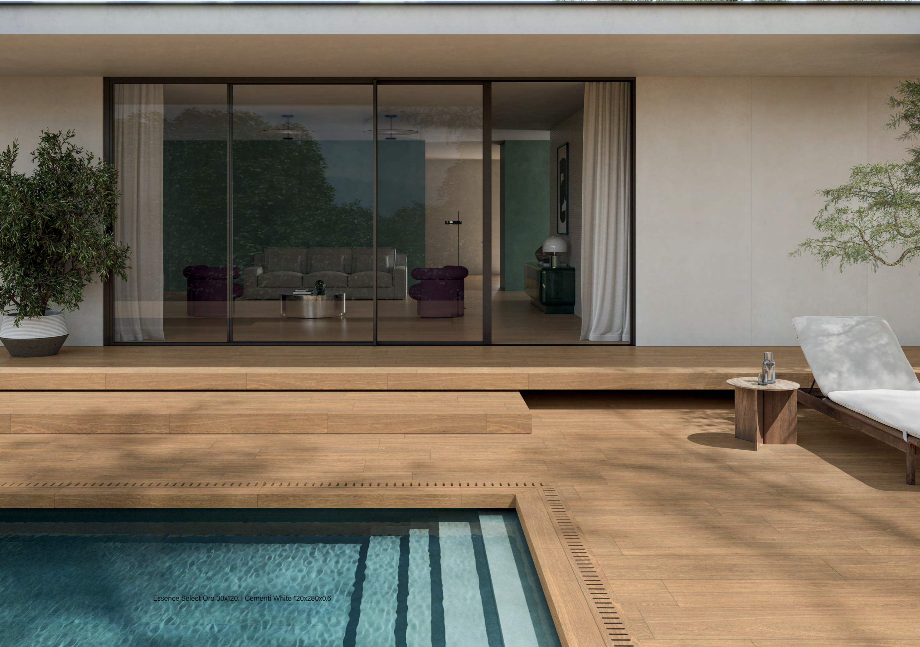
Essence Select Oro 30x120, | Cementi White 120x280x0,6