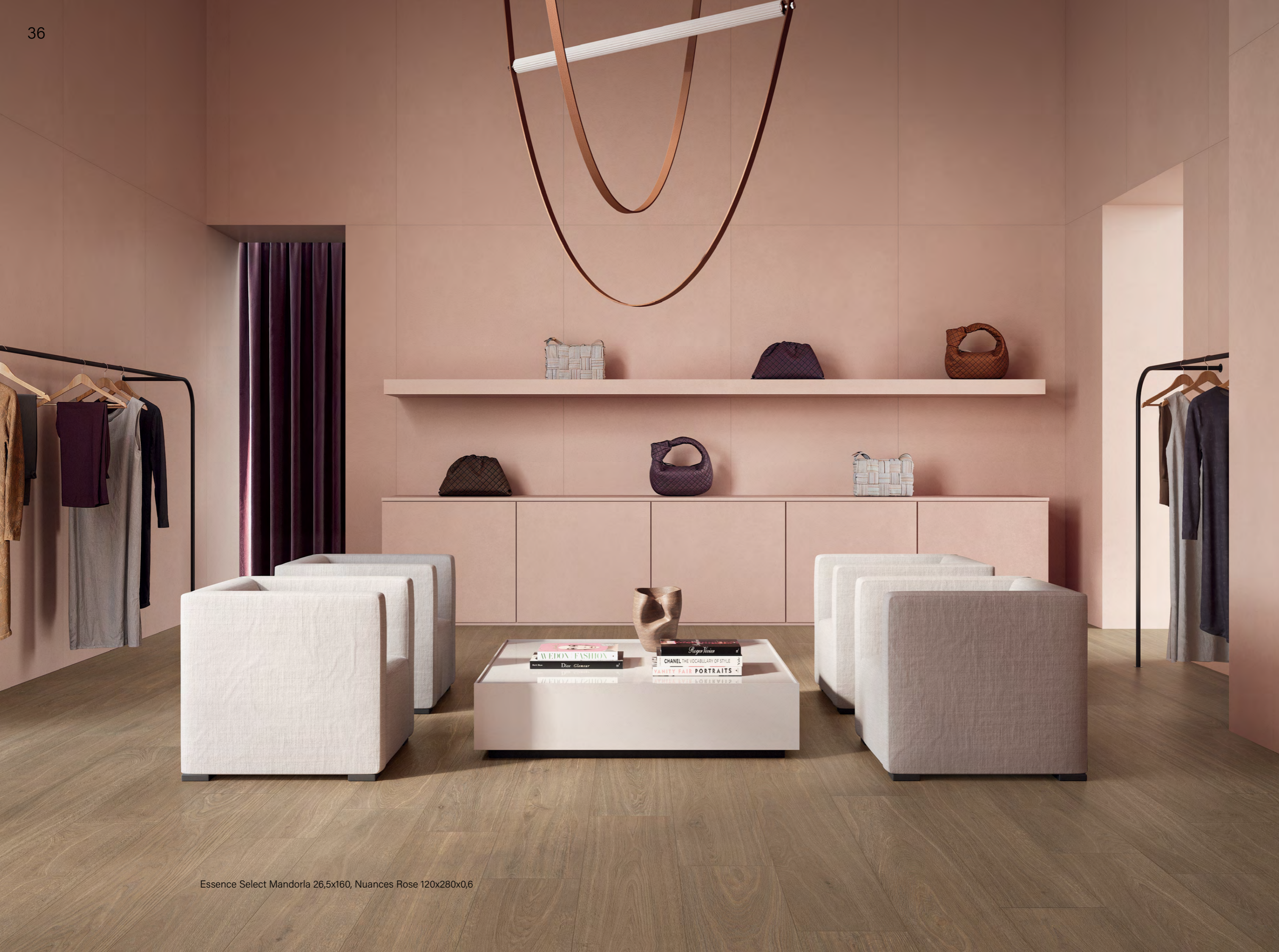
Essence Select Mandorla 26,5x160, Nuances Rose 120x280x0,6