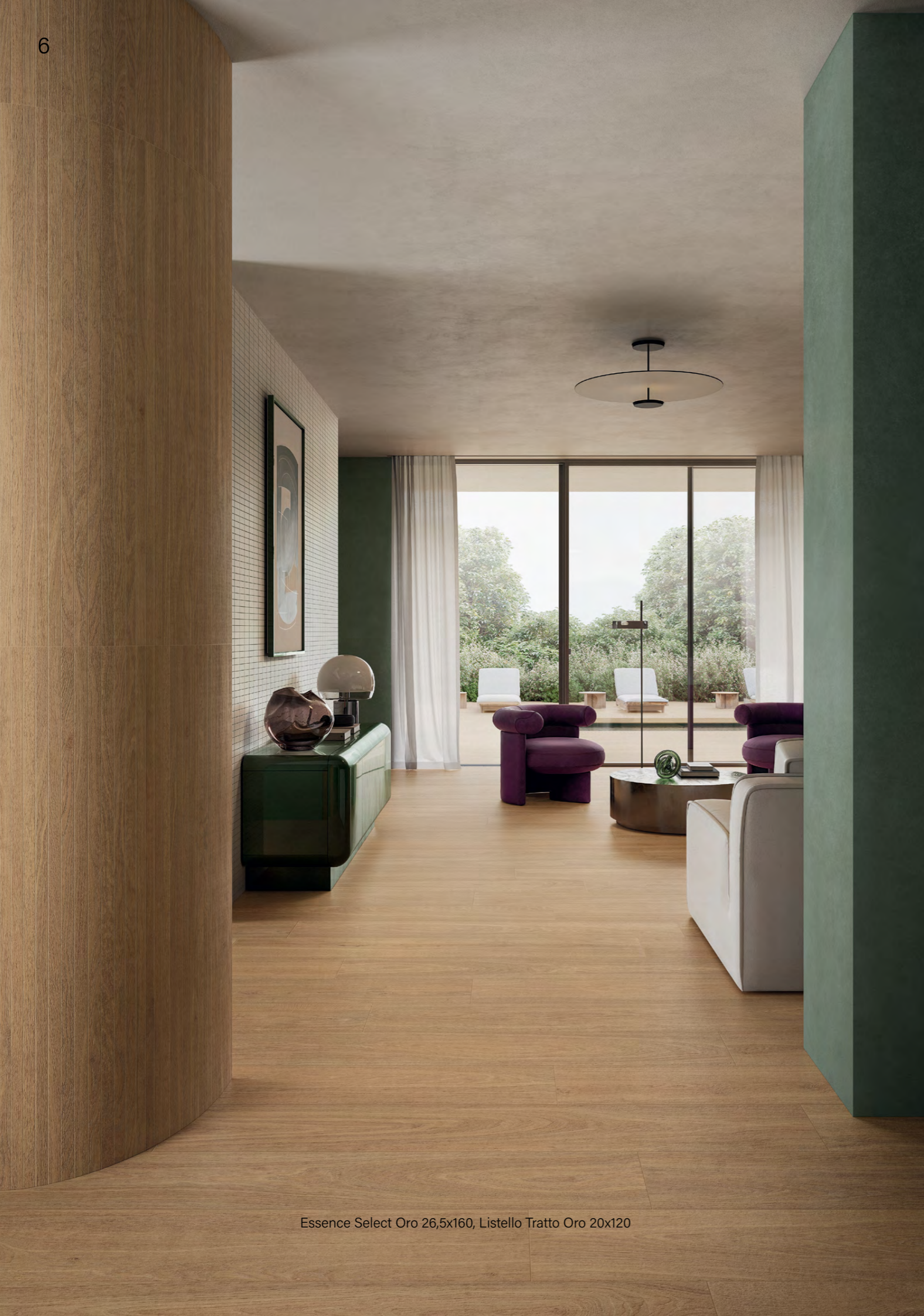
Essence Select Oro 26,5x160, Listello Tratto Oro 20x120